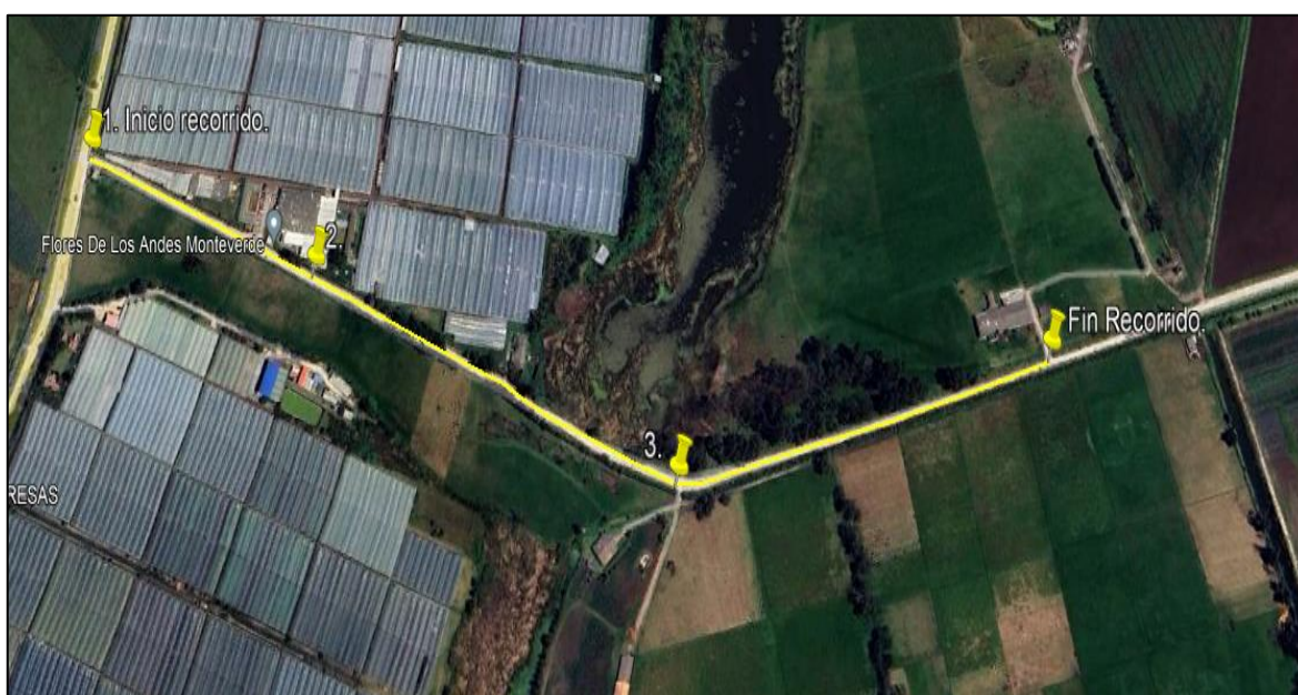
Ilustración 1. Recorrido verificación ambiental – Vereda El Cacique

Se realizó recorrido de control y vigilancia de los componentes ambientales en áreas rurales del municipio de Funza, vereda El Cacique el día 28 de mayo de 2024, desde las Coordenadas 4°45'14.812"N - 74°13'26.165"W hasta las coordenadas 4°45'9.647"N - 74°12'53.25"W (ver ilustración 1. Ruta amarilla), con el fin de verificar las condiciones ambientales, identificar posibles afectaciones a los recursos naturales y realizar las acciones de prevención correspondientes.