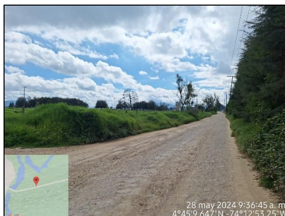
Ilustración 2. Evidencias del recorrido.